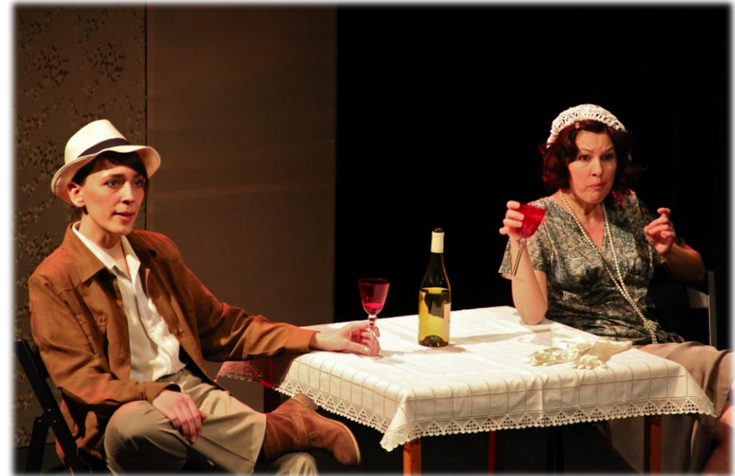
La Chatte | Colette

“ Mais rien, voyons ! Nerveux comme un chat... C'est défendu de mettre ma main sur la tienne ? ”